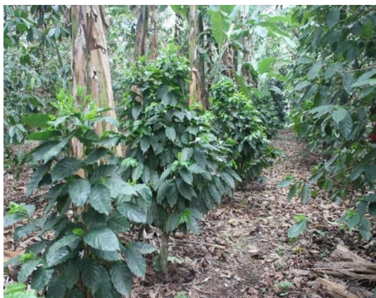
Var. Obata (recepta de 1 año)

la sexta descendencia (F6) que dio origen a la variedad Obatá IAC 1629-20. Esta fue registrada en el Registro Nacional de Variedades Vegetales (RNC) en 1999 y se realizó el lanzamiento oficial por el IAC en el año 2000.