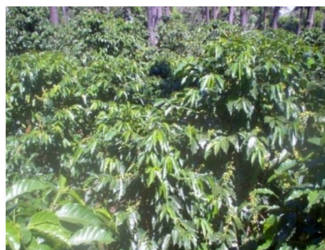
Plantación de la Var. Pache común

Es una mutación de la variedad Típica, encontrada en Santa Rosa, Guatemala, en 1949. Planta de porte bajo, con una altura promedio de 1.80 metros; el crecimiento de las bandolas primarias forma un ángulo de 60 grados con el tallo principal, con buena ramificación de bandolas secundarias, posee entrenudos cortos y abundante follaje. Las hojas son de color verde y consistencia áspera, de forma elíptica. Las hojas nuevas o brotes son de color bronce. La planta presenta una copa bastante plana o “pache”. Por ser planta de porte bajo, tolera vientos moderados.