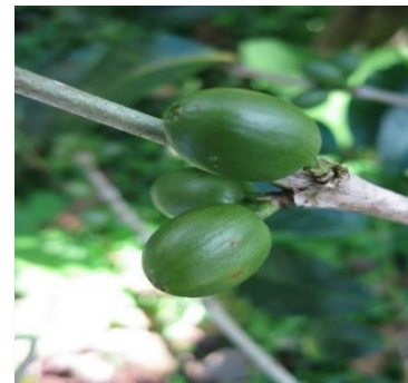
Frutos Var. Típica

Sus hojas son oblongas, elípticas, con base y ápice agudos, de textura lisa y fina; las hojas nuevas o brotes son de color bronceado y presenta entrenudos largos.