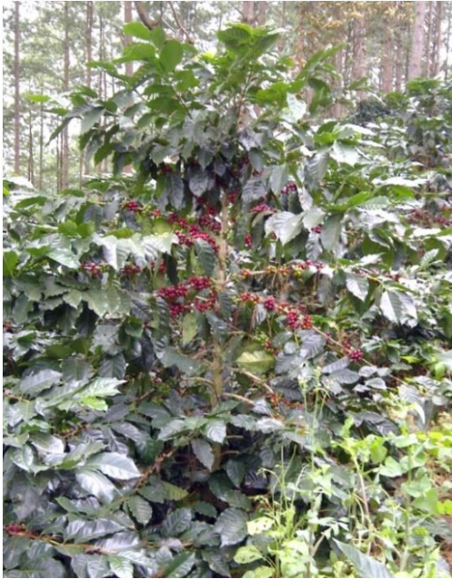
Var. Anacafé 14

La región que dio origen a la Anacafé 14 tiene las características siguientes: se encuentra a una altitud de 1,200 metros sobre el nivel del mar (3,950 pies sobre el nivel del mar), suelos francos