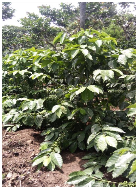
H-1 (2 años)