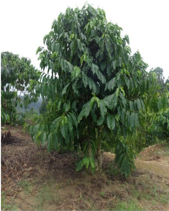
Planta de Robusta (recepada)

En las bandolas hay presencia de yemas que originan los botones florales y posteriormente los frutos. La distancia entre nudos florales varía de 5.7 a 9.2 centímetros.