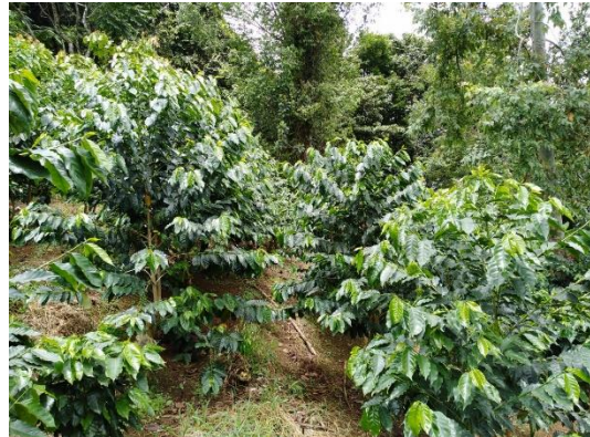
Var. Mundo Novo

Es una planta de porte alto, llegando a alcanzar hasta 3 metros, con gran vigor vegetativo y mucha capacidad de producción. Las bandolas o ramas forman un ángulo de 45 grados con el eje principal, entrenudos intermedios y crecimiento lateral muy abundante, formando palmillas (emisión de bandolas secundarias). Las plantas presentan brotes de color bronce o verde, predominando las de brote bronce. Las hojas son lanceoladas y angostas, semejantes a las de la variedad Bourbon, de color verde ligeramente intenso.