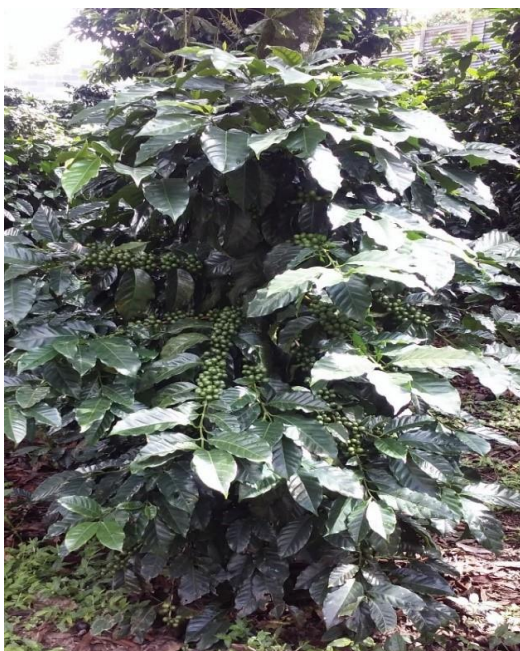
Var. Catimor T-5269

En la década de los años 80, Anacafé estableció parcelas de validación con plantas de la progenie (descendencias) de Catimor T-5269 en fincas de la región cafetalera de suroccidente de Guatemala, buscando generar una variedad con características estables. Se observó buena adaptabilidad en baja y media altitud, alta productividad y taza estándar (Muy buena).