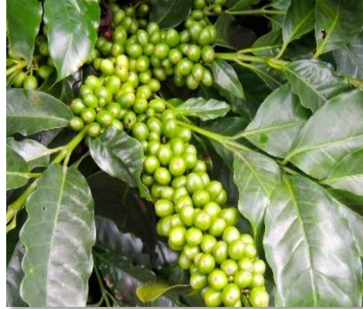
Fructificación Var. Marsellesa

En estudios realizados en 6 diferentes localidades de Nicaragua, de 710 a 1,230 metros sobre el nivel del mar (2,330 a 4,040 pies sobre el nivel del mar): Matagalpa, Boaco, Jinotega, Jinotega, El Cua, Nueva Segovia, obteniendo el valor promedio de 81.3 puntos en análisis sensorial de taza, escala de la Asociación de Cafés Especiales de América (SCAA).