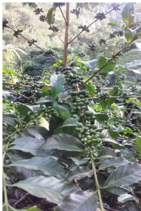
Fructificación Var. Geisha