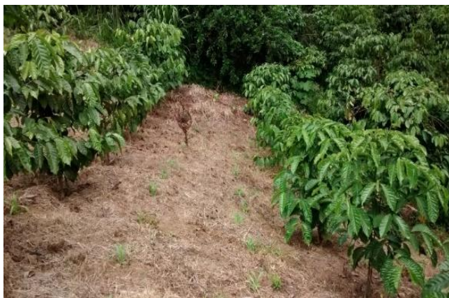
Plantación de Robusta (2 años)

En las plantaciones establecidas se hicieron las primeras observaciones de la tolerancia del Robusta al ataque de nemátodos fitoparásitos que dañan la raíz de los cafetos, lo que llevó más tarde al desarrollo del injerto hipocotiledonar, hoy conocido como injerto Reyna en reconocimiento al Agrónomo Humberto Reyna, su inventor.