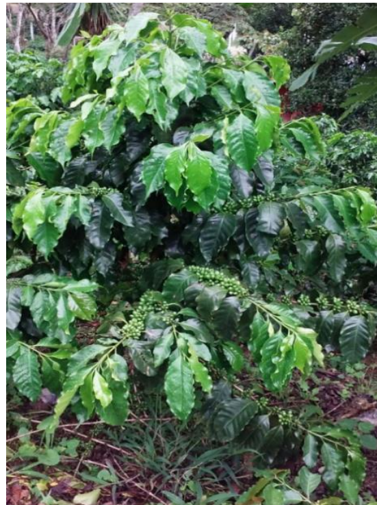
Var. Anacafé 90 o Ihcafé 90

Planta de porte bajo, con una arquitectura foliar medianamente compacta, hojas anchas de color verde oscuro, brotes bronce, ramas largas con entrenudos cortos, precocidad en crecimiento y producción, maduración intermedia, buen vigor vegetativo, adecuada respuesta a las podas, color de frutos rojos con bajo porcentaje de frutos vanos, tamaño de grano mediano y bebida de buena calidad. Se adapta a altitudes arriba de los 1,000 metros sobre el nivel del mar (3,280 pies sobre el nivel del mar).