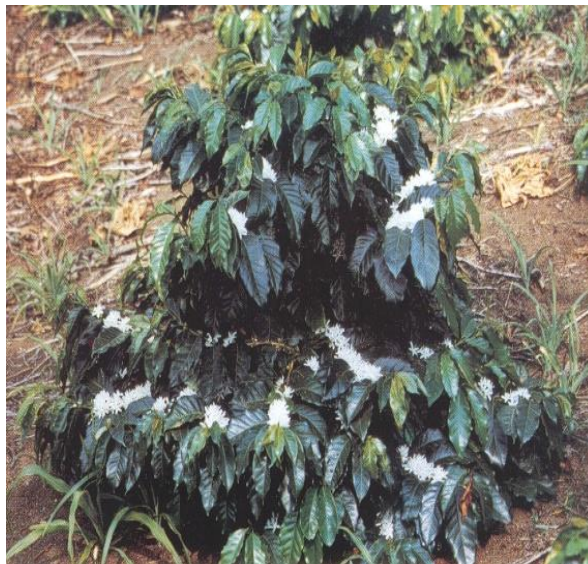
Var. Pache Colís

Es una planta de porte muy bajo, con altura entre 0.80 a 1.25 metros; característica que le permite resistir a los vientos moderados. Tiene entrenudos muy cortos, las ramas primarias forman un ángulo de 45 grados con el tallo principal, con buena ramificación secundaria y terciaria, lo que incide en su abundante follaje, con hojas de consistencia áspera y forma elíptica, de color verde.