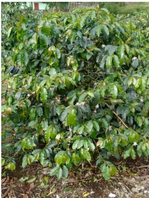
Var. Pache común

Tiene mejor adaptación en rangos de altitud de 1,200 a 1,900 metros sobre el nivel mar (3,930 a 6,200 pies sobre el nivel del mar) y zonas con rangos de precipitación de 1,000 a 2,000 milímetros por año. Por lo anterior, las plantaciones de Pache se han establecido en la región oriental de Guatemala, donde su producción es satisfactoria, sin embargo, esta variedad presenta comportamiento de producción bienal o sea que existe diferencia significativa en dos años consecutivos de cosecha, similar a la variedad progenitora (Típica). Tiene una producción promedio de 35 quintales de café pergamino por manzana (50 quintales por hectárea).