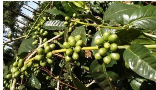
Frutos Var. Maragogipe

Esta variedad es una mutación de Típica, descubierta en Brasil en el año de 1870. Planta de porte alto, superior a las plantas de Típica y Bourbon; las ramas laterales forman ángulo de 75 grados con el eje principal, presentando escasa ramificación secundaria.