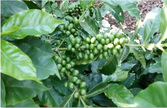
Fructificación Var. Icatú

Esta variedad se retrocruzó varias veces con la variedad Mundo Novo para continuar con la evaluación y selección de características deseables y estables. En el año 1992 se realizó el lanzamiento oficial con el nombre de variedad Icatú por el Instituto Agronómico de Campinas (IAC), Brasil, donde se reporta en la actualidad como moderadamente susceptible a roya.