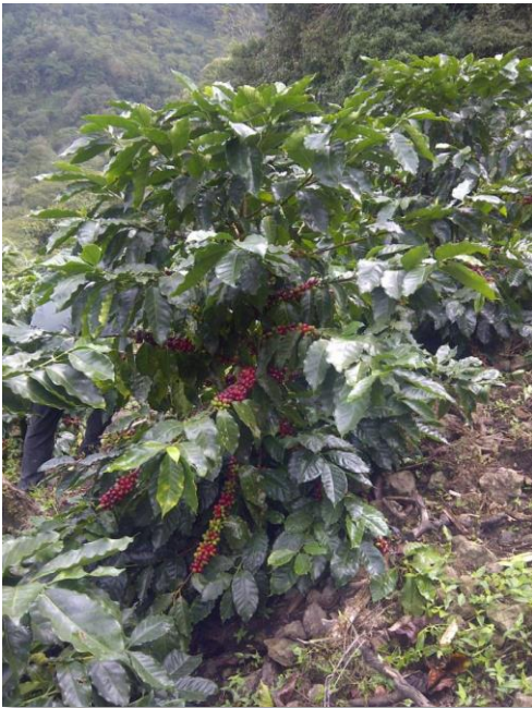
Var. Anacafé 14 (2 años)

Esta variedad se originó en la región oriental de Guatemala a través de un cruce natural de las variedades Catimor T-5175 con Pacamara.