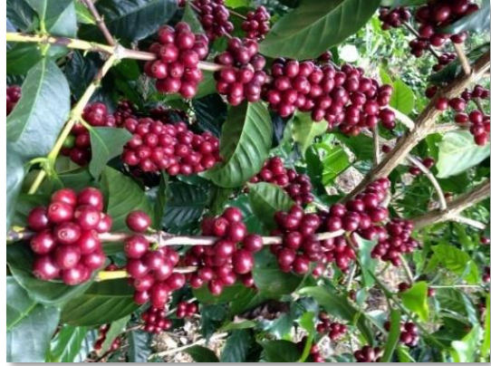
Frutos Var. Bourbon

En la época de su introducción a Guatemala; en la finca experimental Chocolá, San Pablo Jocopilas, Suchitepéquez, se seleccionaron plantas de esta variedad que sirvieron de base para el desarrollo de varios cafetales. Además, otros países realizaron selecciones similares con el propósito de aumentar la productividad de esta variedad, tal es el caso de El Salvador con el Bourbon Salvadoreño y Costa Rica con el Bourbon Montecristo. También, en El Salvador realizaron otra selección proveniente de varias plantas elites de Bourbon, la cual fue denominada Tekisic y liberada como variedad comercial en 1976.