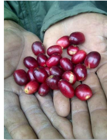
Punto de corte

La región que dio origen a la Anacafé 14 tiene las características siguientes: se encuentra a una altitud de 1,200 metros sobre el nivel del mar (3,950 pies sobre el nivel del mar), suelos francos