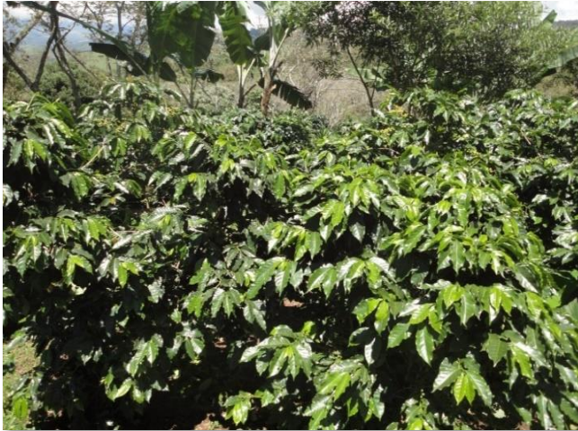
Var. Villa Sarchí

Esta variedad produce frutos de color rojo y frutos amarillo, predominando en la caficultura guatemalteca la de frutos rojo; produce granos medianos (zaranda 16), con alta capacidad de producción, en condiciones óptimas podría llegar a un promedio de 45 quintales de café pergamino por manzana (64 quintales por hectárea).