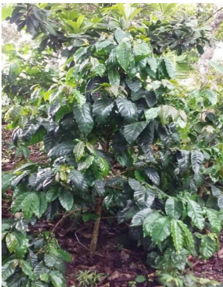
Var. Pacamara (3 años)

Es una variedad obtenida del cruzamiento entre las variedades Pacas y Maragogipe realizado en El Salvador. Sus descendencias combinan características propias del Pacas, como porte bajo, entrenudos cortos y buena productividad, con frutos y hojas de tamaño grande de la variedad Maragogipe.