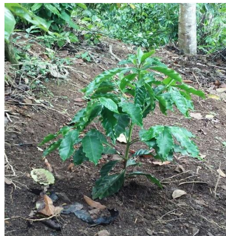
Var. Marsellesa (siembra nueva)

Se origina del cruce de la variedad Villa Sarchí 971/10 y el Híbrido de Timor CIFC 832/2, creado en el año 1959 por el CIFC, Oeiras, Portugal. Las siguientes generaciones fueron evaluadas en Brasil y posteriormente introducidas por el CATIE a Centroamérica. En 1991 fueron introducidas a Nicaragua las líneas T-18139, T-18140, T-18138, T-18141, T-18137 para que se continuara con la selección para el desarrollo de