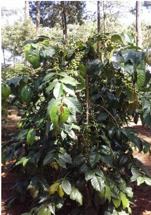
Var. Maragogipe (descopada)