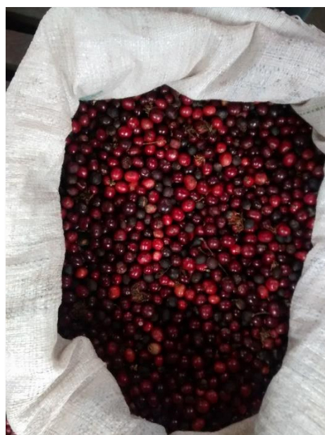
Corte óptimo de frutos para beneficiado húmedo

La producción de café Robusta 2015-2016 en Guatemala, se estima entre 70,000 a 75,000 quintales de café oro. De este total, el 60% es procesado por la vía de beneficiado húmedo y el restante 40% por secado natural. El área de producción se ubica principalmente en los departamentos situados en la costa sur, en un área aproximada de 6,000 manzanas (4,195 hectáreas).