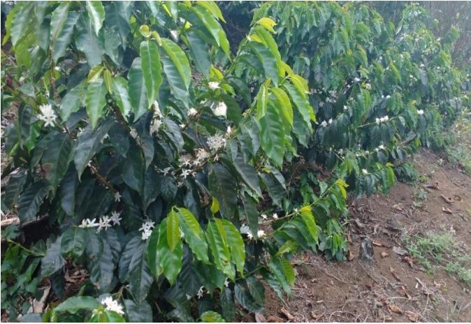
Var. Lempira o Costa Rica 95 (T-8667)

Planta de porte bajo, brotes bronce, de alta productividad (50 a 70 quintales pergaminos secos por manzana), con buena adaptabilidad en zonas de 800 a 1,400 metros sobre el nivel del mar (2,600 a 4,600 pies sobre el nivel del mar).