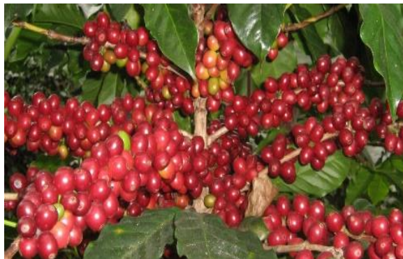
Frutos maduros de la Var. Catuai

Es el resultado del cruzamiento artificial de las variedades Mundo Novo y Caturra, realizado en Brasil. La introducción de Catuai al país se realizó alrededor de 1970. Se adapta muy bien en rangos de 600 a 1,370 metros sobre el nivel del mar (1,970 a 4,500 pies sobre el nivel mar) en la costa sur y de 1,070 a 1,675 metros sobre el nivel del mar (3,500 a 5,500 pies sobre el nivel del mar) en la zona central, oriental y norte del país.