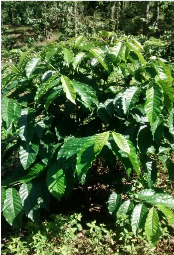
Var. Robusta (2 años)