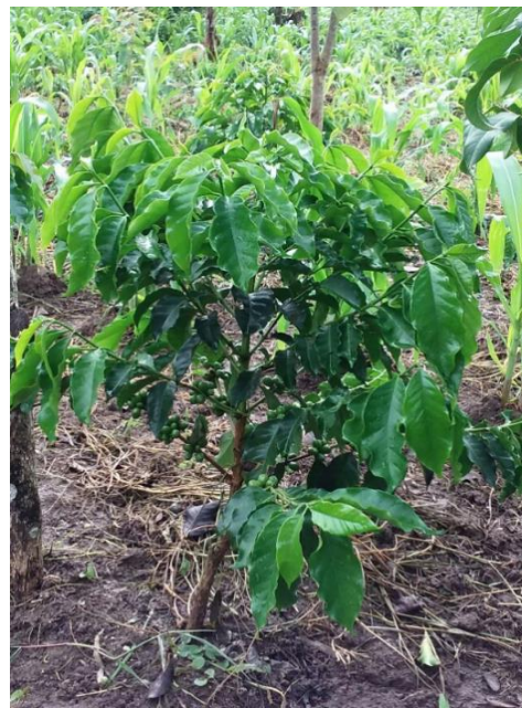
Var. Castillo El Tambo

En relación a su calidad de taza, Cenicafe realizó pruebas comparándola con variedades Típica, Caturra, Bourbon y Tabi. De los resultados se destaca que la calidad de las variedades Castillo regionales son muy homogéneas. La bebida presenta cuerpo y amargor suaves, aroma y acidez pronunciadas para grados medios de tostación bajo condiciones similares de beneficiado, torrefacción y preparación de la bebida; en conclusión, no se detectaron diferencias en la calidad de la bebida comparada a las variedades mencionadas.