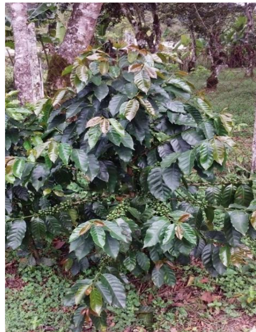
Var. Castillo (2 años)

Las generaciones F4 y F5 se manejaron como una mezcla de semillas de las plantas seleccionadas en las generaciones anteriores y sin realizar anotaciones genealógicas de los individuos. La producción se registró por planta y se descartaron las plantas que se apartaron del fenotipo de Caturra, las que exhibieron anormalidades o estaban afectadas por otros problemas en el campo y las de baja producción. Los mejores genotipos se incrementaron rápidamente durante dos o tres generaciones.