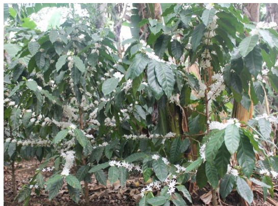
Var. Catucaí L43

Planta de vigor y productividad alta, porte medio, ramificación abundante de ramas secundarias, entrenudos cortos, brotes verdes o bronceados. Produce frutos rojos o amarillos, de tamaño mediano y ciclo de maduración mediana.