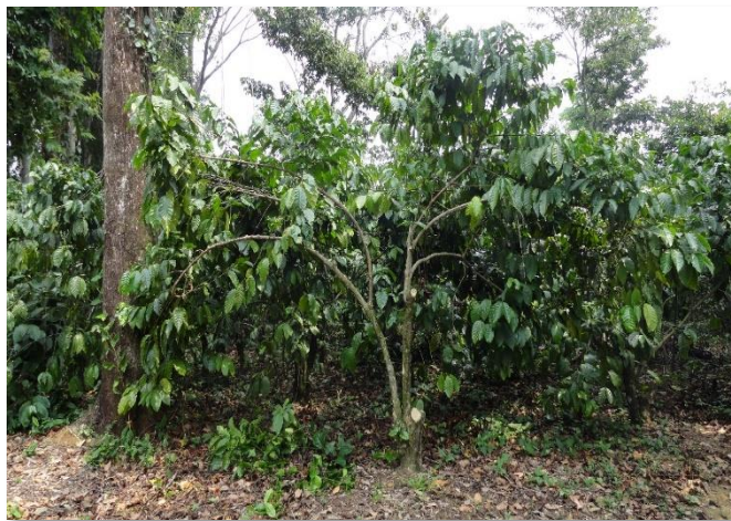
Var. Robusta (Poda selectiva y agobio)

Las plantas de café Robusta presentan dos tipos de crecimiento aéreo, el vertical u ortotrópico (tallo) y lateral o plagiotrópico (ramas laterales o bandolas).