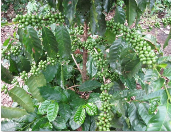
Fructificación Var. Cuscatleco

Posee alto vigor híbrido, de producción precoz, con resistencia a la roya, sin embargo, es ligeramente susceptible a las enfermedades mancha de hierro o cercóspora ( Cercóspra coffeícola ) y ojo de gallo ( Mycena citricolor ).