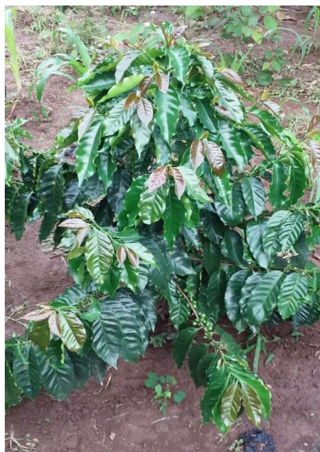
Var. Lempira (2 años)

Estudios organolépticos de la bebida, realizados en los laboratorios de Catación del Instituto Salvadoreño para Investigaciones del Café en El Salvador y del Instituto hondureño del café en Honduras, coincidieron en determinar una similar calidad de taza de la variedad Lempira con las variedades Caturra y Catuaí. Además, estudios desarrollados en los laboratorios del Centro de Cooperación Internacional en Investigación Agronómica para el Desarrollo (CIRAD), Montpellier, Francia, sobre la composición química y organoléptica de la variedad confirman una buena calidad de taza, semejante a la de las variedades de Caturra, Catuaí y Bourbon.